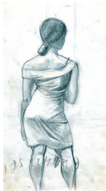
Carlos Berlanga Muchacha de espaldas (s/f) Lápiz sobre papel. 21,4 x 12 cm. Colección particular. Madrid.