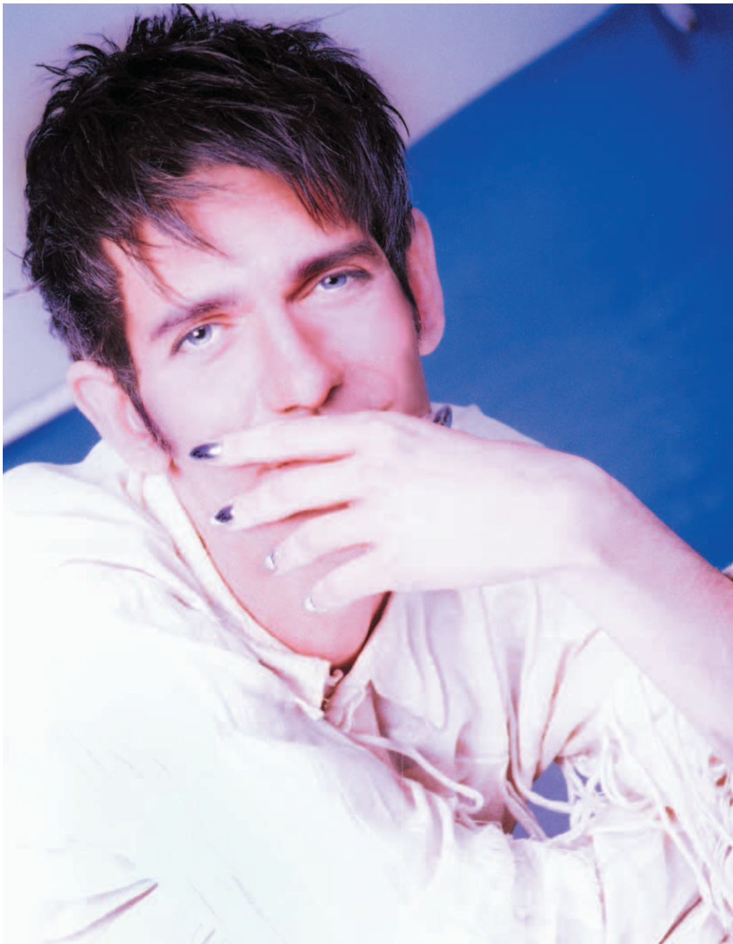
Álvaro Villarrubia. Indicios de arrepentimiento (1994). Fotografía sobre papel. 60 x 40 cm. Colección particular. Madrid.