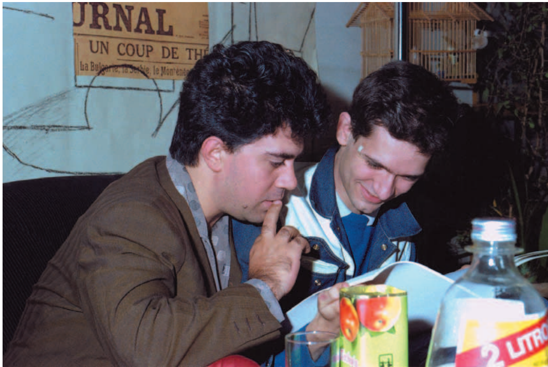
Javier G. Porto. Pedro y Carlos (1981). Fotografía sobre papel. 40 x 60 cm. Colección particular. Madrid.